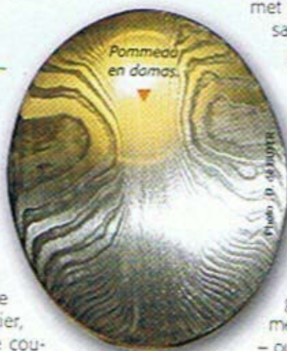
Pommeau en damas.

La touche "custom" n'a pas été oubliée puisqu'il est possible de faire personnaliser le pommeau de frappe par un motif ou d'y faire graver son prénom ou un logo.