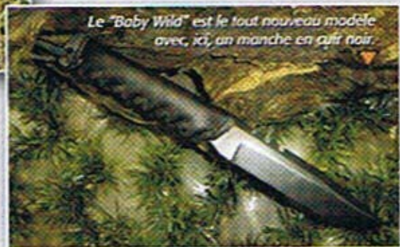
Le "Baby Wild" est le tout nouveau modèle avec, ici, un manche en cuir noir.

Enfin, un accessoire destiné aux archers dont la flèche ne s'est pas plantée dans un arbre mais a trouvé plus vicieux d'aller se faufiler sous les herbes ou sous les feuilles mortes : la griffe métallique équipée d'un manche pour dégager la surface du sol et retrouver la flèche enfouie. La longueur totale de la griffe est à peu près égale à celle d'une