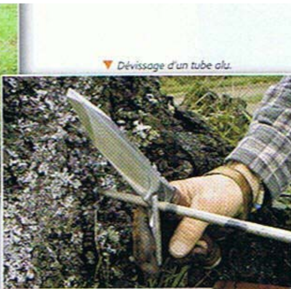
▼ Dévissage d'un tube alu.

Une pochette compartimentée, en cuir de qualité similaire à l'étui du couteau, offre la possibilité de rassembler tous les accessoires pour un transport rationnel et une disponibilité immédiate.