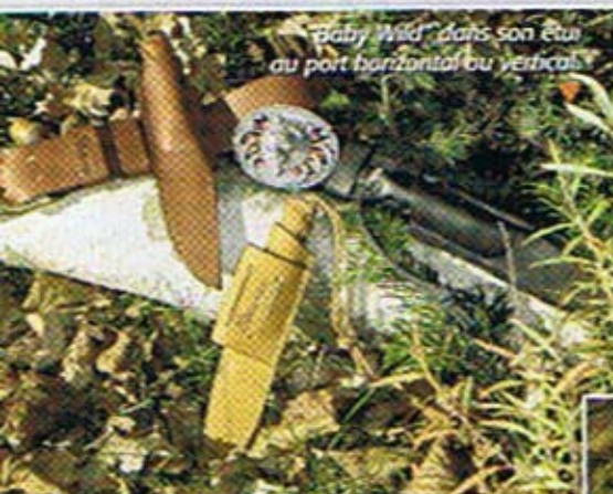
"Baby Wild" dans son étui au port horizontal ou vertical.

La pierre à feu qui peut prendre la place de l'extracteur dans le logement de l'étui et qui permet d'allumer un feu