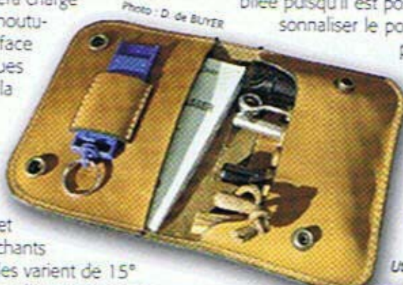
La pochette "accessoires" ouverte.

C'est ainsi qu'une étude en CAO (conception assistée par ordinateur) est menée. Une maquette réalisée par frittage voit le jour et permet d'apporter