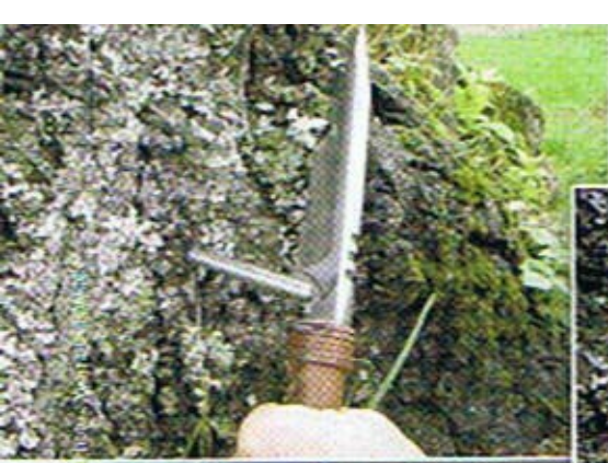
▲ Extraction d'une lame de chasse.